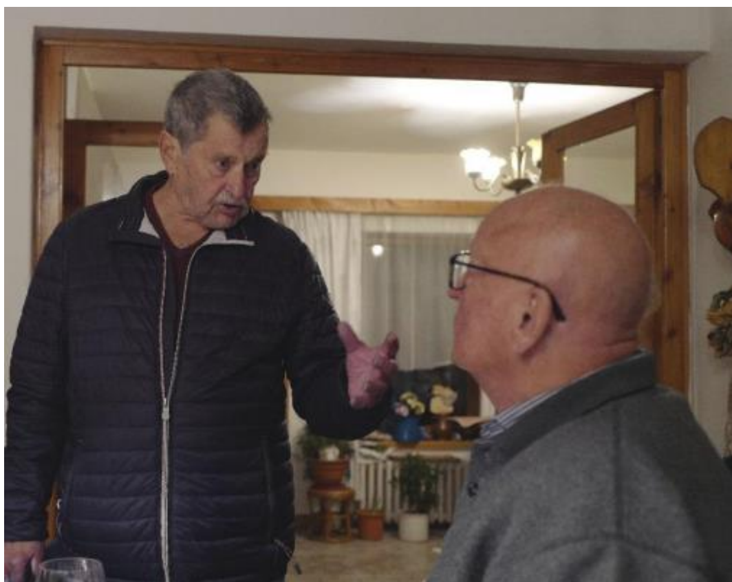
a tady zase s Cacidlem