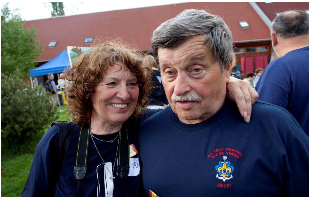
Jindy byl ovšem rozverný až okouzující.