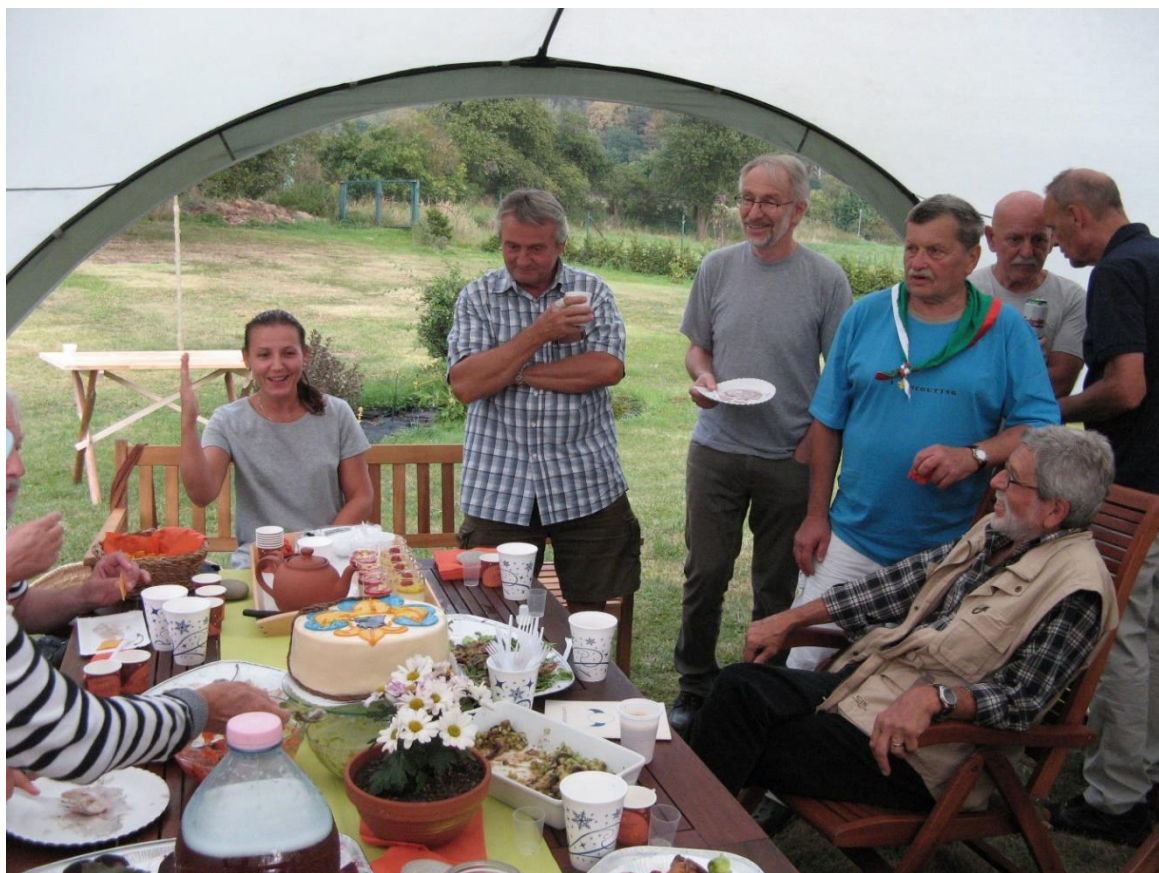
Bobánkovy sedmdesáté narozeny