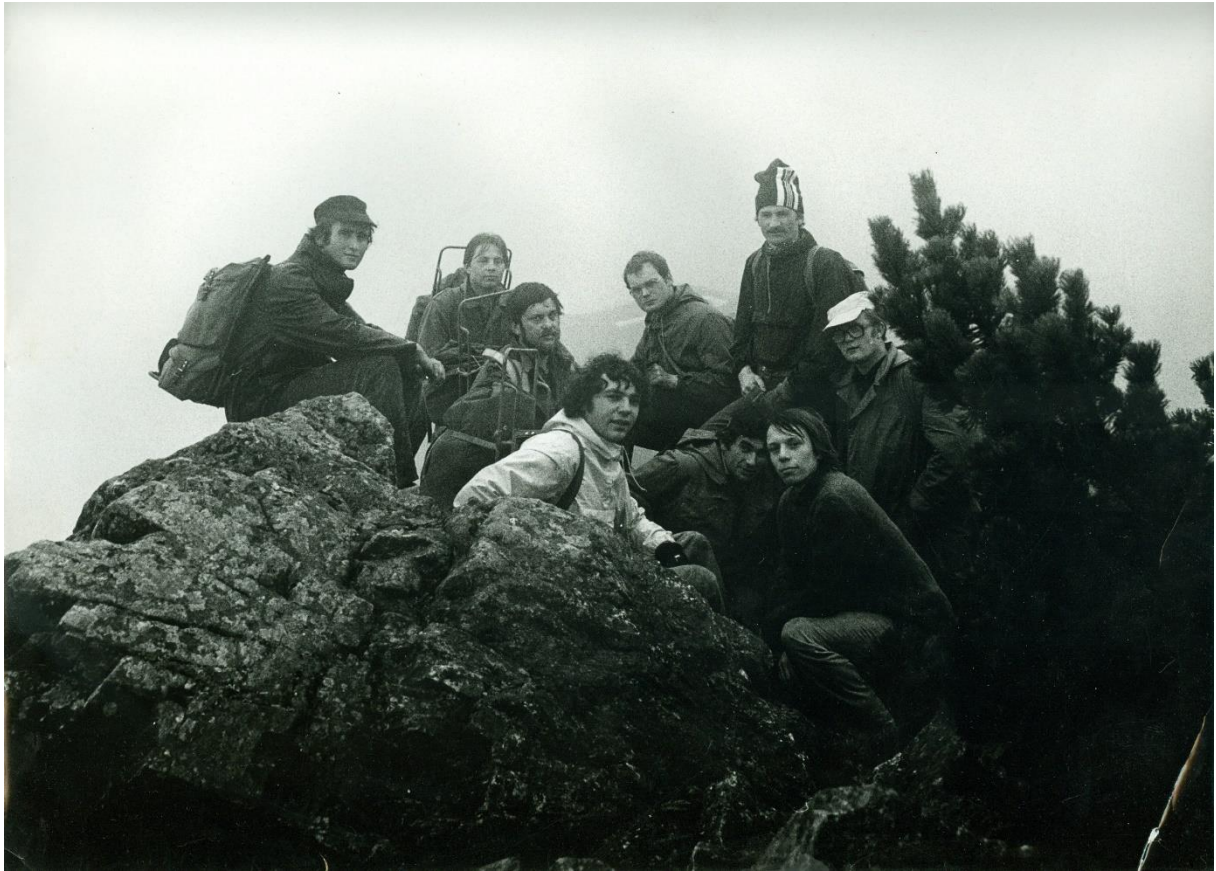
Kozí Hřbety 1971