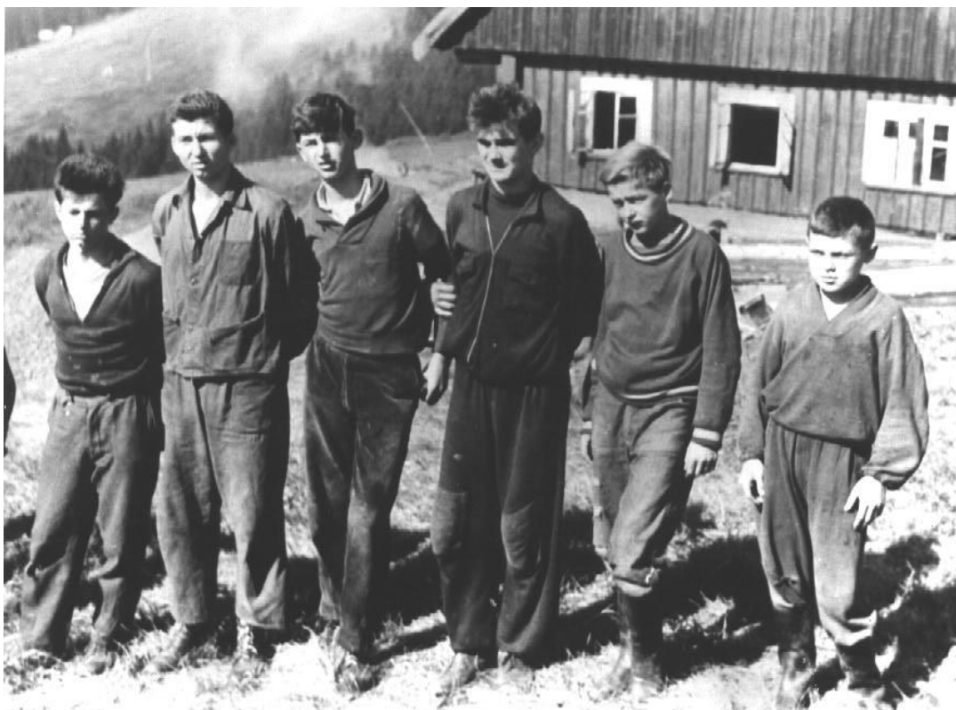
Kormidelník Wikingů na Skočce v létě 1957